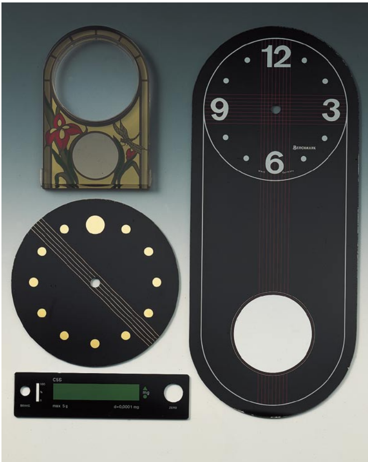
Skalen und Displays aus Glas oder Plexiglas

Hohe Qualität, ein gutes Preis-Leistungs-Verhältnis, aber auch terminliche Zuverlässigkeit und Flexibilität sind für Sie wichtige Gesichtspunkte bei Bedruckungsaufträgen.