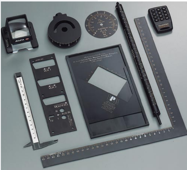
Bedrucken von Metall- und Kunststoffteilen Flache- und runde Körper in höchster Präzision - je nach Erfordernis und Wirtschaftlichkeit im Siebdruck oder Tampondruck