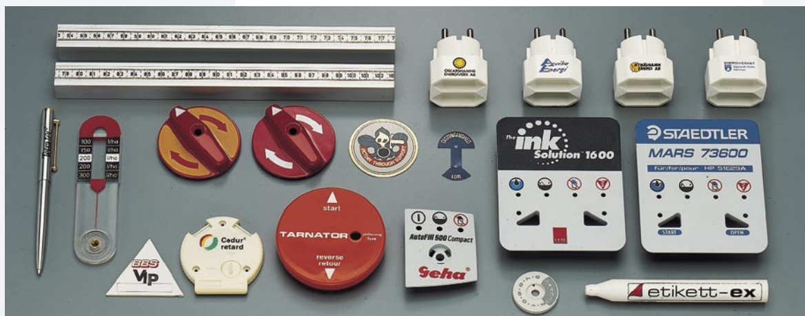
Ein- und mehrfarbige Drucke, absolut passergenau Lackierarbeiten, eingebrannt und luftgetrocknet