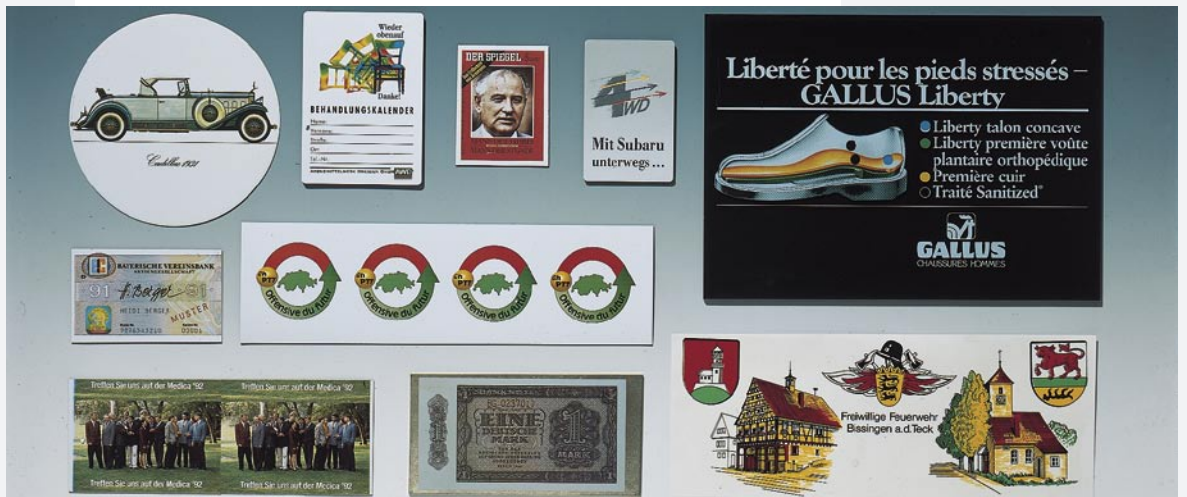
Mehrfarben-Drucke im Flach-Offset auf Metall- und Kunststoffe Feine Raster-Drucke : Für die Wiedergabe von Fotos besonders geeignet