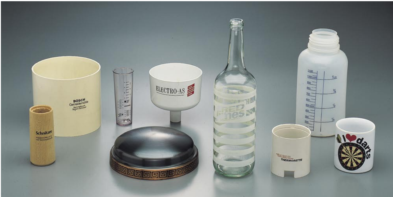
Runde Körper aus Glas, Metall oder Kunststoffen: ein- oder mehrfarbig bedruckt mit hoher Genauigkeit