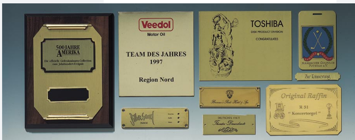
Schilder und Plaketten: Bedruckt Geätzt und farbig ausgelegt Schutzlackiert

Eigene Rahmenfertigung Oberflächenbearbeitung auf Aluminium oder Messing: fein geschliffen oder poliert