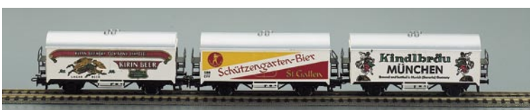
Feinster Tampondruck mit absoluter Passergenauigkeit - höchste Präzision

Wir helfen Ihnen gerne - denn durch unsere langjährige Erfahrung können wir die diffizilsten Probleme lösen.