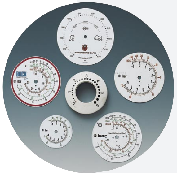
Zifferblätter, Barometer-, Thermometer-, Hygrometer-, Manometer-Skalen komplett gestanzt und verformt

Bedrucken von Gehäusen, Rahmen und sonstigen Teilen